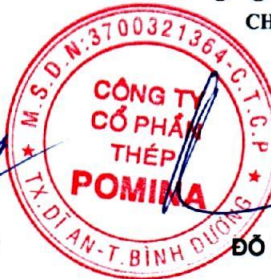
ĐỖ XUÂN CHIÊU